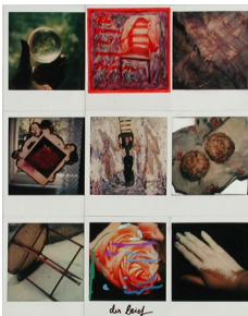
Alle Frauen sind immer daheim o. J. 9 Polaroids, teilweise collagiert, beschriftet und bearbeitet, 32 x 25.5 cm o. Mitte: Alle Frauen sind immer daheim, u. Mitte: der Brief, Selbstporträt Inv. Nr. PO 0273