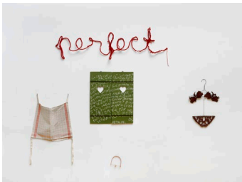
perfect, o. J. Wandinstallation: Draht, Wolle, Küchentuch, Holzladen, Kreide, Drahtkleiderbügel, Holz, Ring Dimensionen variabel, ca. 180 x 220 cm Inv. Nr. Kunstmuseum Liechtenstein 2004.08