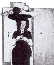
o.T., 1974 [Selbstporträt beim Stricken des Körbchens] S/W Fotokopie einer Fotocollage, Faserstift, 8 x 6,9 cm, Selbstporträt (Original verschollen) Inv. Nr. FP 0092