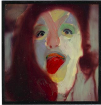
o.T. o. J. Polaroid, bearbeitet, 10.8 x 8.8 cm, Selbstporträt Inv. Nr. PO 0117