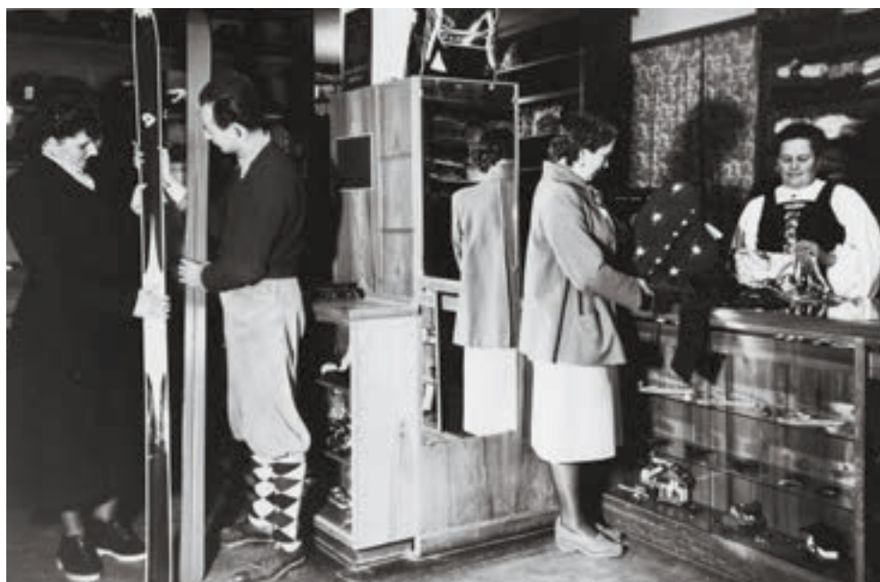
Kaufhaus Strolz, Firmenarchiv Familie Strolz

Um 1900 trugen die Skifahrer Kniebundhosen aus steifem Loden, Gamaschen aus dickem Filz,