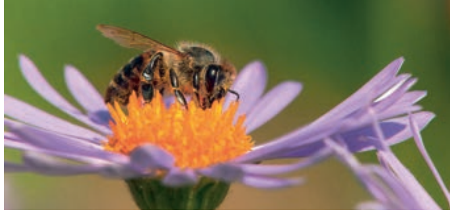
Honigbiene, Foto: www.bienen.info

Außerdem wird die bestehende Ausstellung aus Graubünden um regionale Montafoner Schwerpunkte zur historischen Bienenzucht im Tal und die aktuelle Situation erweitert und ergänzt. Exkursionen in den Naturraum, aber auch zu Imkern stellen das Rahmenprogramm zur Ausstellung dar.