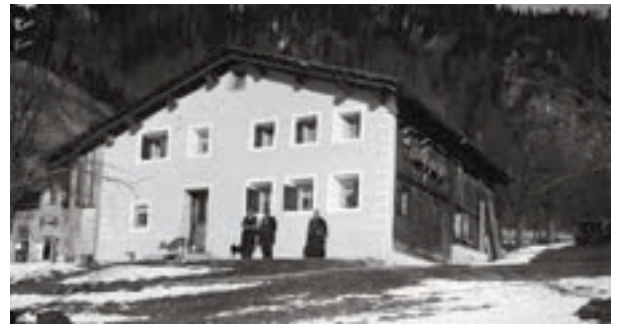
„Dalberto-Haus“ in Wald am Arlberg, im Kern aus dem 14. Jahrhundert, um 1935

A uf der historischen ArchitekTour durch Klösterle fällt der bis heute erhaltene Charakter eines Straßendorfes auf. Historische Gasthäuser und andere Gebäude hängen eng mit der Verkehrsgeschichte zusammen und sind Bestandteil der Tour. Von der ursprünglichen Siedlung, die rund um das im Hochmittelalter vom Johanniterorden gestiftete Klostergebäude entstand, ist nicht viel mehr geblieben als der Ortsname „Zum Kloster“ oder „Zum Klösterlin“, wovon sich bis spätestens Anfang des 15. Jahrhunderts der Name des ganzen Tals ableitete. Dalaas dürfte zunächst auf der Sonnenseite besiedelt und erst später Richtung Talboden verlagert worden sein. Der Name wird auf die romanische Bezeichnung eines landwirtschaftlichen Gebäudes zurückgeführt. Die weit verstreuten Parzellen des Ortes, deren Besiedlung deutlich nachgelassen hat, fallen bis heute auf. Der Rundweg beginnt in der Parzelle „Platz“ (beim heutigen Kristbergsaal), führt über den „Ruafa“ – einer Anfang des 20. Jahrhunderts auf Anregung des