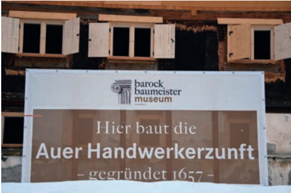
Die Auer Handwerkszunft ist unterstützend in dieses Projekt involviert.

beachtlichen Herausforderungen meisterten. Entlang dieser sozialhistorischen Phänomene widmet sich Au „seinen“ ortsbezogenen Fragestellungen: Warum und in welchem sozialen Milieu konnte eine solche hundertjährige Erfolgsgeschichte ausgerechnet dort beginnen? Und was hat diese Geschichte mit dem Ort und der Region heute zu tun?