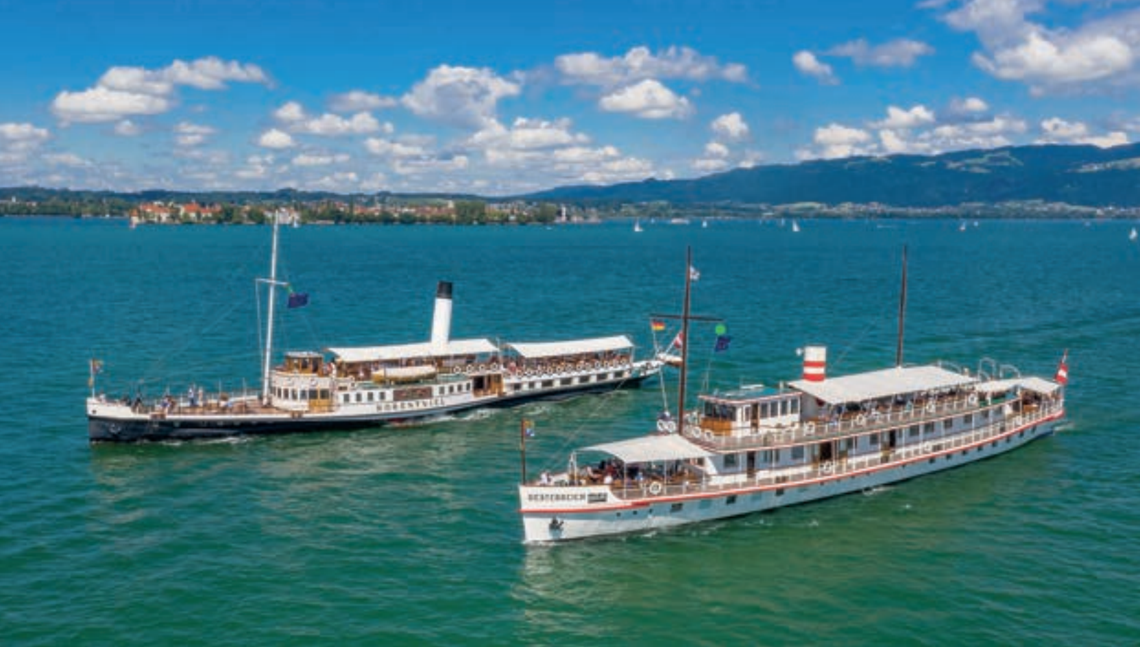
Die MS Oesterreich und das Dampfschiff Hohentwiel. Beide kreuzen heute noch den Bodensee und erzählen ihre jeweilige Geschichte der Bodenseeschifffahrt.