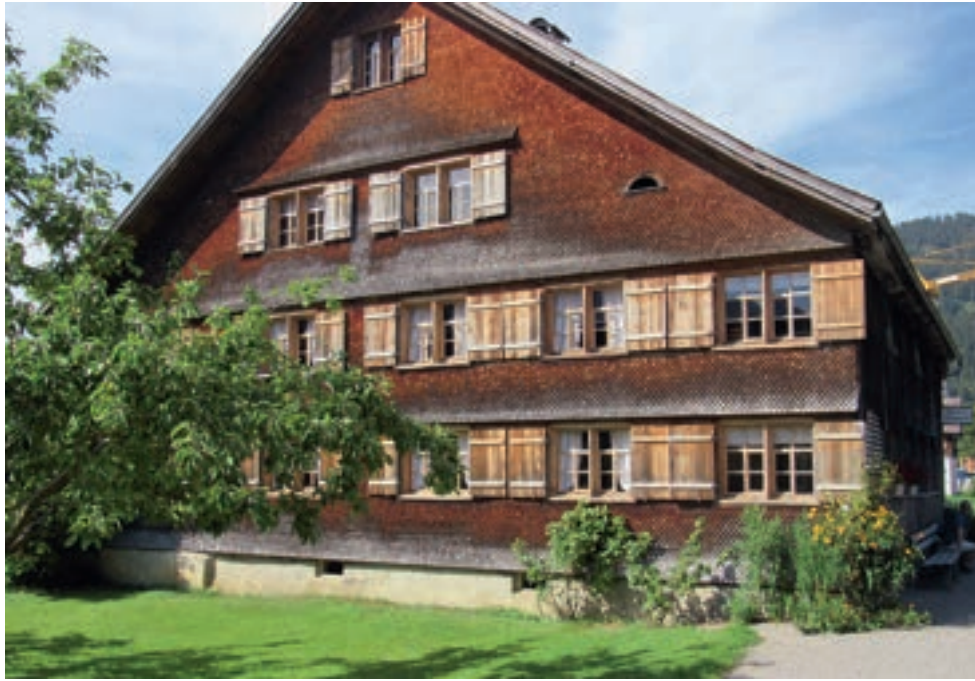
Das Heimatmuseum Bezau befindet sich in einem typischen Bregenzerwälder Bauernhaus aus dem 18. Jahrhundert. Das denkmalgeschützte Gebäude mit bestens erhaltener, originaler Einrichtung gibt Einblick in die Wohnkultur vergangener Zeiten und beherbergt unter anderem eine Ausstellung sämtlicher Trachten des Bregenzerwaldes sowie eine wertvolle Sammlung sakraler Kunst. Das Haus wird um einen Zubau erweitert.

forderungen. Es wäre bedauerlich, wenn hier mit dem Zubau eine Zittersituation entstünde, etwa im Sinne zweier Museumshälften nach dem Motto: hier das Alte, dort das Neue; hier die Barockbaugeschichte, dort die übrige Geschichte.