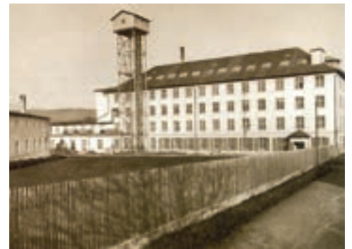
Ganahlareal, Obere Fabrik, Anfang 20. Jh.