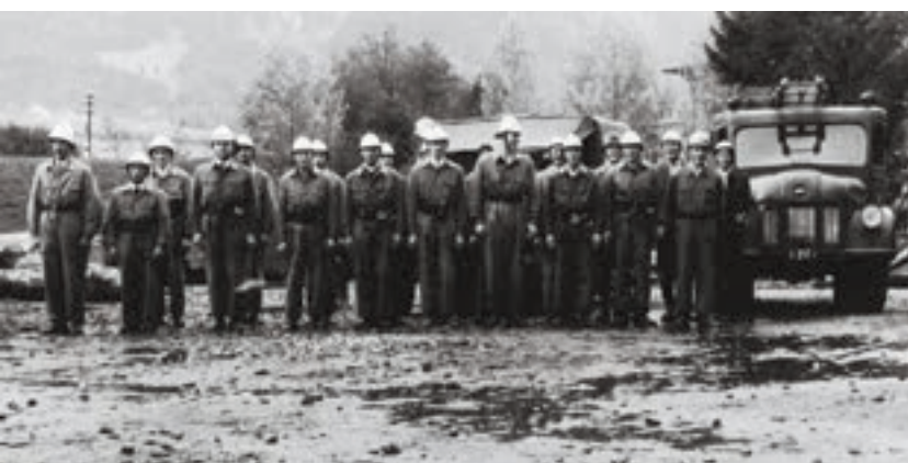
Feuerwehrrübung beim Sägewerk Pfister, 1957