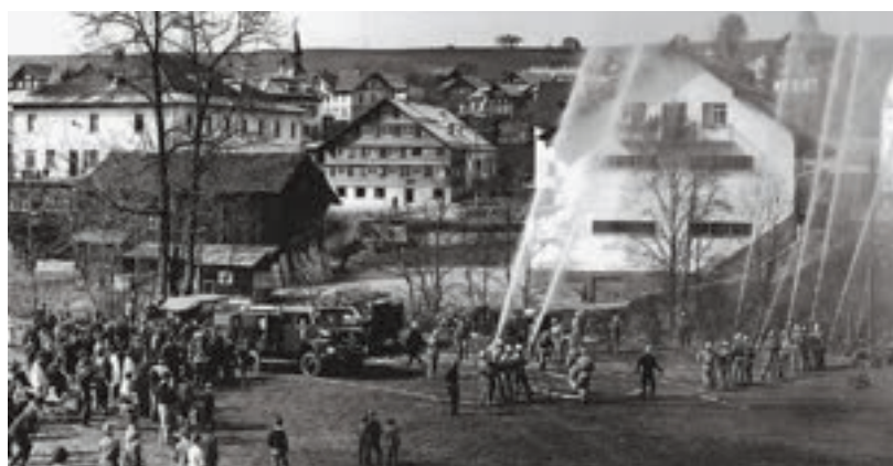
Schauübung anlässlich der Fahrzeugweih 1963