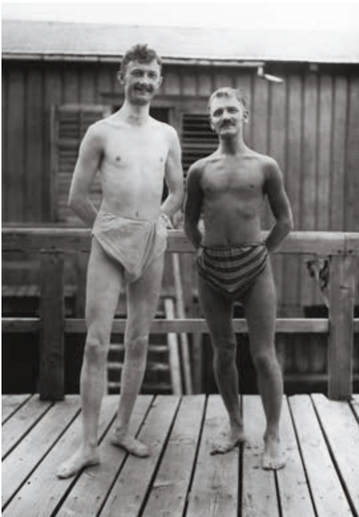
links: In selbstgenähten Badehosen. Städtische Badeanstalt um 1916

1. Mai bis 31. Oktober 2021 Dienstag bis Sonntag 10.00 bis 18.00 Uhr