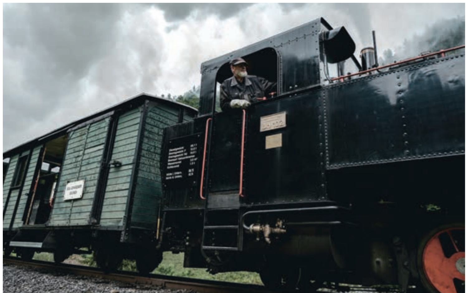
Nachdem die Bahn 1985 offiziell eingestellt war, sorgte ein Verein dafür, dass ein Teil der historischen Strecke erhalten blieb.

In den ersten Jahrzehnten nahm die Bahn eine wesentliche Rolle im Güterverkehr ein. So ersetzte die neue Strecke beispielsweise die Flößerei. Auch in das Tal konnten die Produkte nun leichter geschafft werden. „Die Bahn wurde gerne angenommen, der Warenverkehr ließ in den 70er Jahren aber merklich nach“, sagt Rüt. Der Ausbau der Straßen und der aufkommende PKW- und LKW-Verkehr ab der Zwischenkriegszeit trug seinen Teil dazu bei, dass