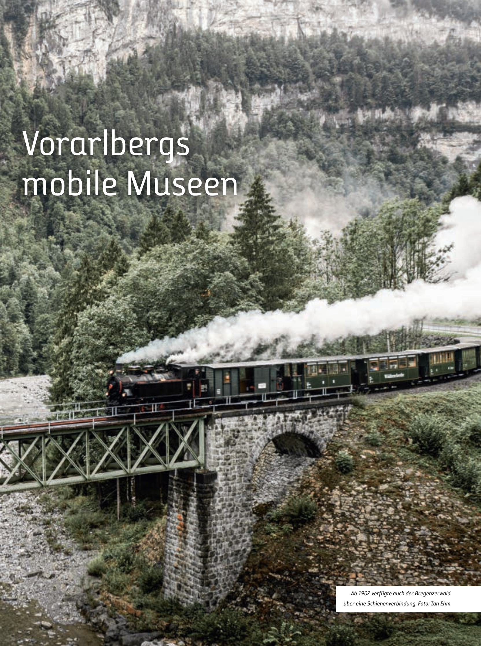
Ab 1902 verfügte auch der Bregenzerwald über eine Schienenverbindung.