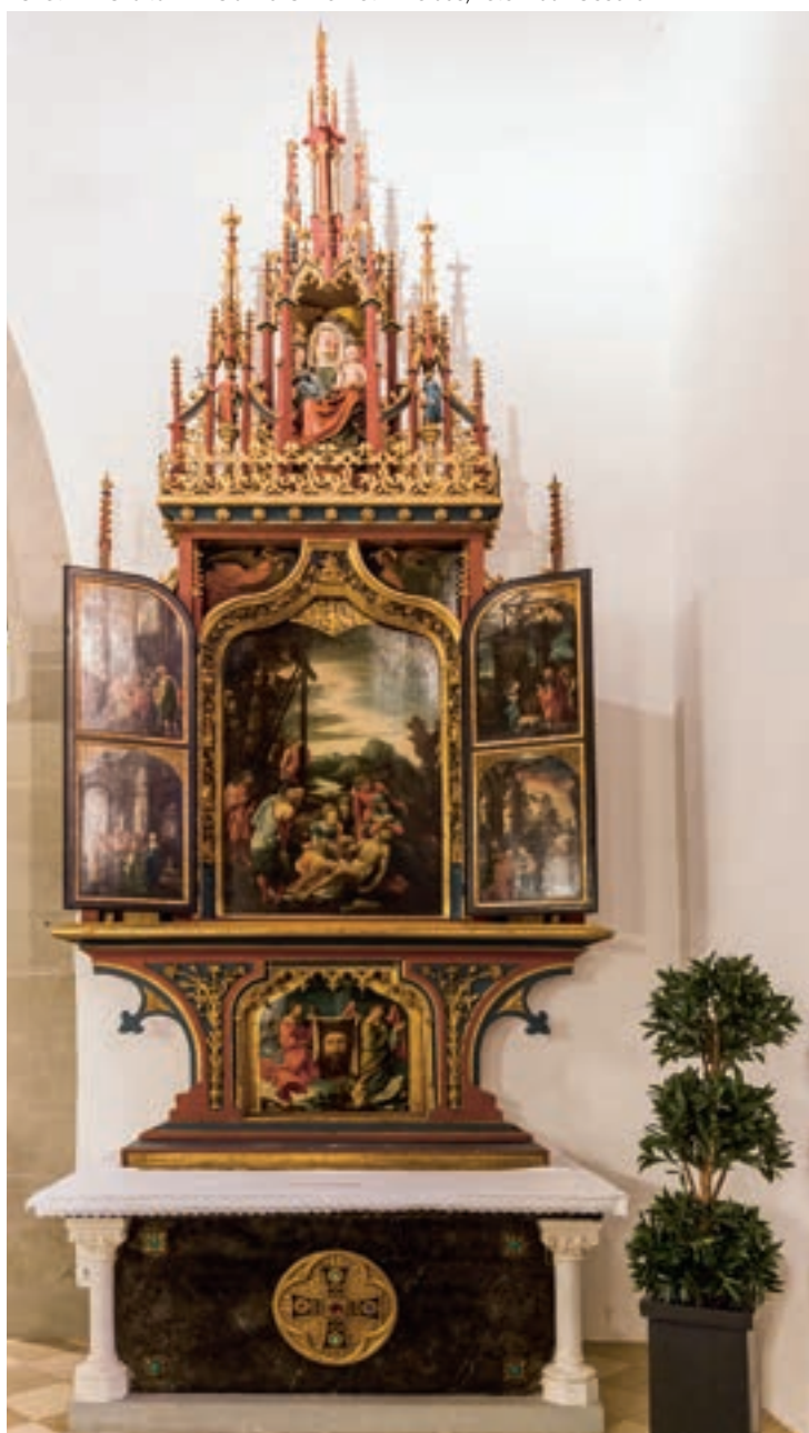
Der St. Annenaltar im Feldkircher Dom St. Nikolaus, Foto: Nadine Jochum

Perspektive und das Aufblühen des Porträts. Als eine Art „Begleitprogramm“ zu Wolf Huber und dem St. Annenaltar möchte die Ausstellung über den künstlerischen Ausdruck an das Denken und Handeln einer Welt im Umbruch heranführen. „Die Wahrnehmungs-, Denk- und Handlungsweisen dieser Epoche wirken bis heute fort und bedürfen auch der kritischen Hinterfragung“, betont Hans Gruber. Ein umfangreiches Rahmenprogramm begleitet die Ausstellung: von wissenschaftlichen Fachvorträgen zu neuesten Erkenntnissen des Werks Wolf Hubers und der „Donauschule“ über zahlreiche Führungen zu historischen, kunsthistorischen und philosophischen Themen.