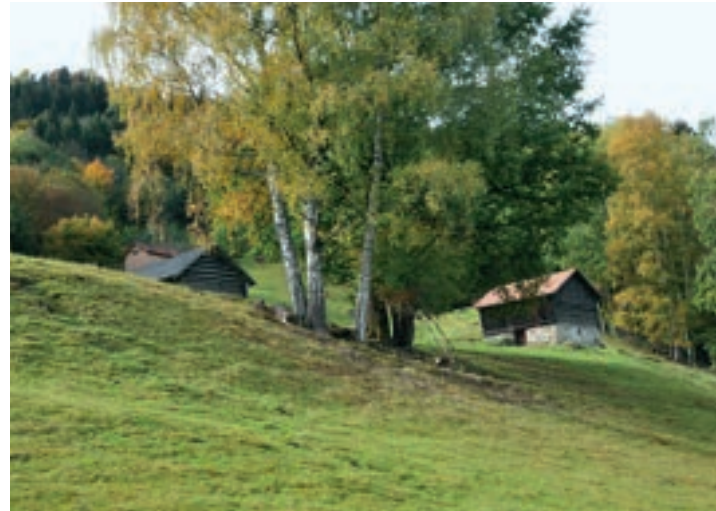
Heubargen auf der Galetscha

„Was macht Heimat für den Einzelnen aus?“ Dieser Frage geht die Artenne Nenzing in diesem Sommer mit ganz unterschiedlichen Projekten nach. Der Titel der Hauptausstellung „Ein Stück Heimat“ impliziert bereits, dass es viele „Stücke“ von Heimat gibt. Künstler*innen aus Vorarlberg werden „ihr“ Stück Heimat auf unterschiedliche Weise präsentieren . Eine kleine Expositur-Ausstellung der Nutzung von „Heubargen“ (Heuhütten) thematisiert den Aspekt der Natur als Heimat . Weiters findet oberhalb von Nenzing das Festival „Galetscha. Dinna Dussa“ statt. Text: Monika Kühne