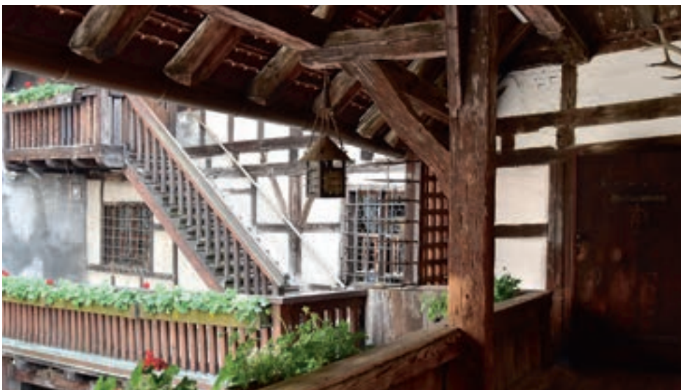
Wehrgang der Schattenburg

Genauere Programminformationen: www.schattenburg.at/de/veranstaltungen Alle Anmeldungen für Führungen unter: besuch.museum@schattenburg.at Anmeldung für die Führung „Geheimnisvolle Schattenburg“ unter: tourismus@feldkirch.at