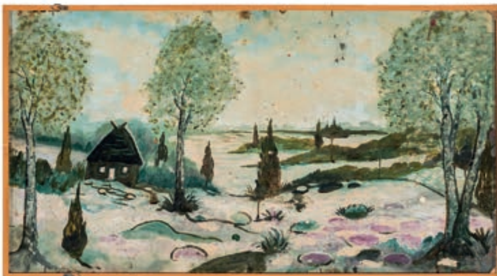
Die Gemälderückseite eines Blumenstillebens Burtschers birgt ein weiteres Werk des Künstlers – eine Landschaft mit Haus –, zu sehen im Museum Großes Walsertal.

Publikation zur Ausstellung Willibald Feinig (Hg.) Kein Stern stört den Andern Denkmal für Otmar Burtscher 76 Seiten, zahlreiche Abbildungen Verlag Bibliothek der Provinz (artedition)