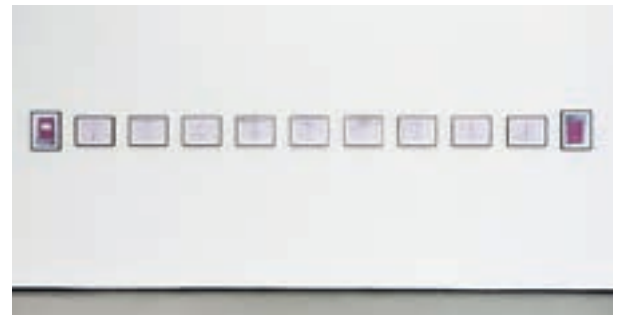
Cana Bilir-Meier, Grammatikheft , 2019

und jugoslawischer ‚Gastarbeiter*innen‘. Ohne sie wäre der wirtschaftliche Aufstieg nicht erfolgt. Als die Lustenauer Stickereiindustrie aufgrund ihrer Abhängigkeit vom nigerianischen Markt in den 1990er Jahren zerfiel, waren die Migrant*innen noch immer da, hatten Kinder, Kindeskinde. Doch in den Archiven sucht man ihre Geschichten und Erinnerungen weitestgehend (noch) vergebens. Als ‚Gastarbeiter*innen‘ der xten Generation werden sie bis heute nicht als Protagonist*innen und Wissensproduzent*innen verstanden. Migrantisch situiertes Wissen im gesellschaftlichen Diskurs als solches anzuerkennen, ist genauso eine Voraussetzung für die postmigrantische Gesellschaft wie die kritische Reflexion des ‚Anderen‘ und seiner Entstehung.