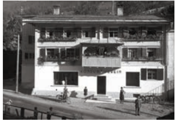
„Wachterhaus“ in Dalaas, um 1930

Das Projekt „ Historische ArchitekTouren “ dokumentiert historische Bauwerke und deren Nutzung sowohl im Klostertal wie in verschiedenen weiteren Regionen Vorarlbergs und arbeitete deren jeweilige Geschichte interdisziplinär auf. Durch historische Fotografien und Schriftquellen, Interviews mit Zeitzeug*innen, Bauforschung und Dendrochronologie konnten viele neue Erkenntnisse zur Baugeschichte gewonnen werden. Sie dienten als Basis für die Konzeption von regionalen und regionsübergreifenden thematischen Routen, welche die historischen Bauwerke vorstellt. Eine Wanderausstellung präsentiert alle am Projekt beteiligten Regionen. Text: Monika Kühne