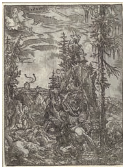
Wolf Huber Der Drachenkampf des heiligen Georg Holzschnitt, 1520