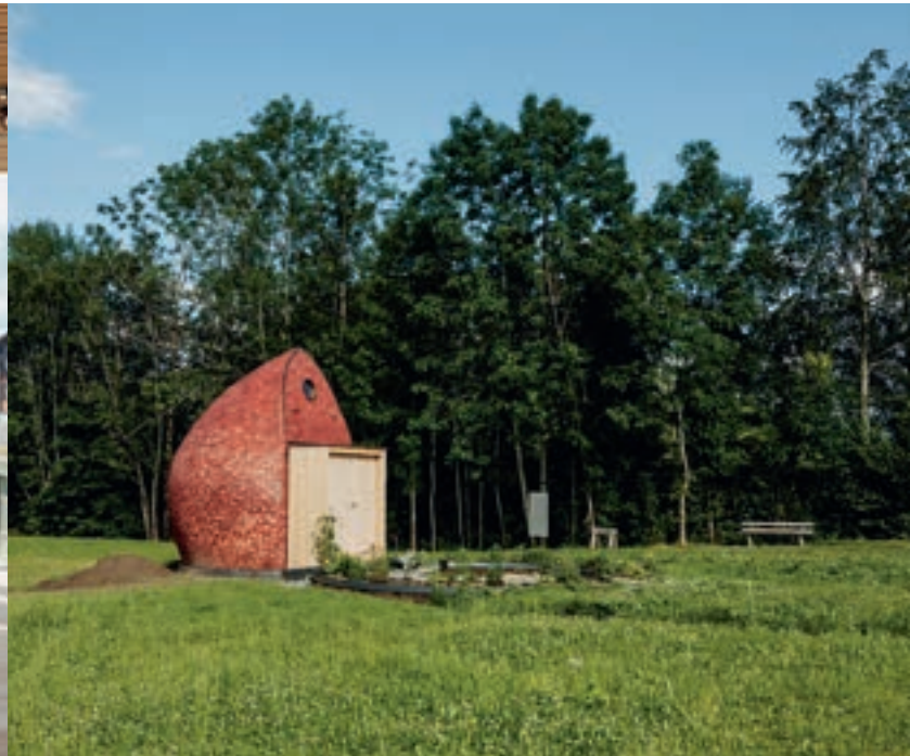
Der „Raum für Geburt und Sinne“ besteht aus Lehm, welcher Fremd- und Schadstoffe bindet, Wärme speichert, weltweit verfügbar ist und der Natur zurückgegeben werden kann.

In verschiedene Stationen setzt sich die Ausstellung mit der Geburtskultur aus unterschiedlichen Blickwinkeln auseinander. Im Bereich GEBURT VERSTEHEN erfahren die Besucher*innen mehr über den physiologischen Vorgang einer Geburt. PRAxis BETRACHTEN spürt möglichen Gründen dafür nach, weshalb es heute kein einziges Geburtshaus mehr im Land gibt (bis in die 1970er Jahre hinein gab es 27). Darüber hinaus widmet sich dieser Bereich den Themen Hausgeburt, Kaiserschnitt sowie Reproduktionstechnik und geht der Frage nach, wann, wie und warum die Geburtshilfe von einem rein von Frauen betreuten Feld zu einer technisch-medizinischen, männlichen Domäne wurde. KULTUR LEBEN stellt weltweite Rituale und Bräuche rund um die Schwangerschaft, die Geburt und das Wochenbett vor. Diese sind unterschiedlich, trotzdem lassen sich Gemein-