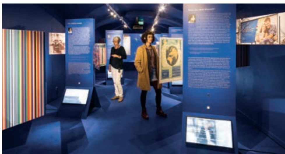
Ausstellungsansicht

Schon der österreichische Schriftsteller Stefan Zweig sah in seiner Autobiografie „Die Welt von gestern“ in der Vereinigung Europas die einzige Möglichkeit, zukünftige Kriegsgefahr und Nationalismus abzuwenden. Doch 76 Jahre nach dem Zweiten Weltkrieg ist Europa aktuell von einem Rückfall in nationalistische und fremdenfeindliche Ideologien bedroht. Werte der Aufklärung, die die Grundlage europäischer Verständigung nach den Katastrophen des 20. Jahrhunderts bildeten, werden in ihr Gegenteil verkehrt und so zum Mittel der Abschottung und der Ausgrenzung. Das Jüdische Museum Hohenems veranschaulicht in seiner aktuellen Ausstellung „Die letzten Europäer. Jüdische Perspektiven auf die Krisen einer Idee“ dieses Thema anhand von verschiedenen Biografien. Text: Susanne Emerich