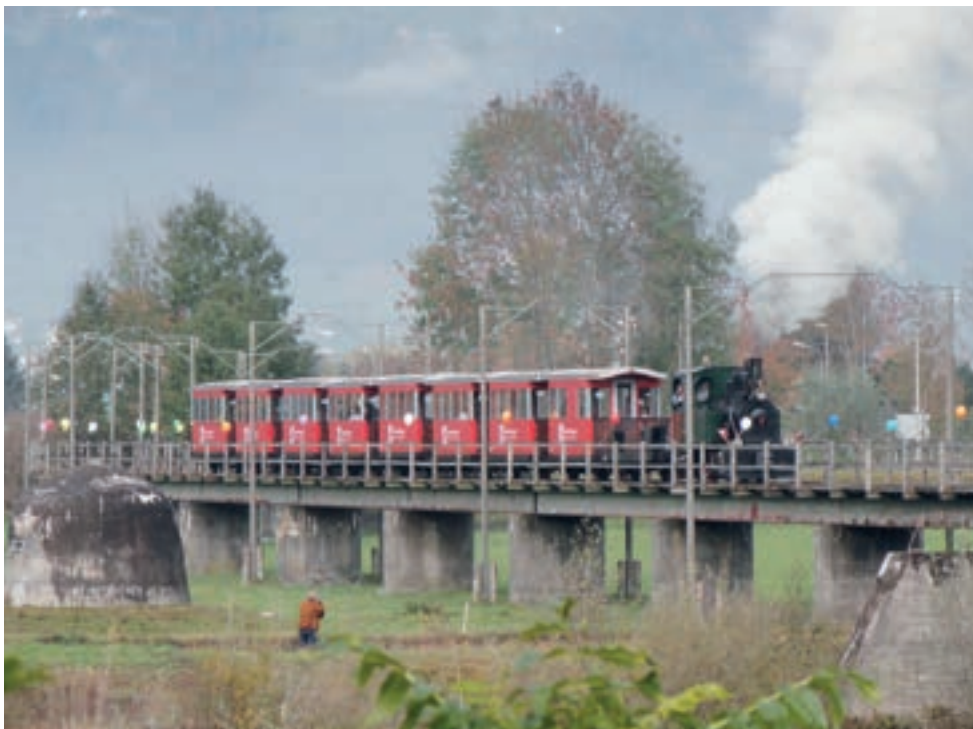
Eine der letzten Fahrten über die Dienstbahnbrücke Kriessern-Mäder. Dampflokomotive St. Gallen mit Personenwagen auf der Vorflutbrücke (Rheinvorland Schweizerseite), die im Jahr 2012 abgebrochen wurde.

Die Dritten im Bunde der mobilen Museen sind die MS Oesterreich und das Dampfschiff Hohentwiel. Beide kreuzen heute stolz den Bodensee und erzählen einen Teil Schifffahrtsgeschichte. Bereits Anfang des 19. Jahrhunderts gab es Dampfschiffe am See. Die Schiffe dienten primär als Verlängerungen der Bahn.