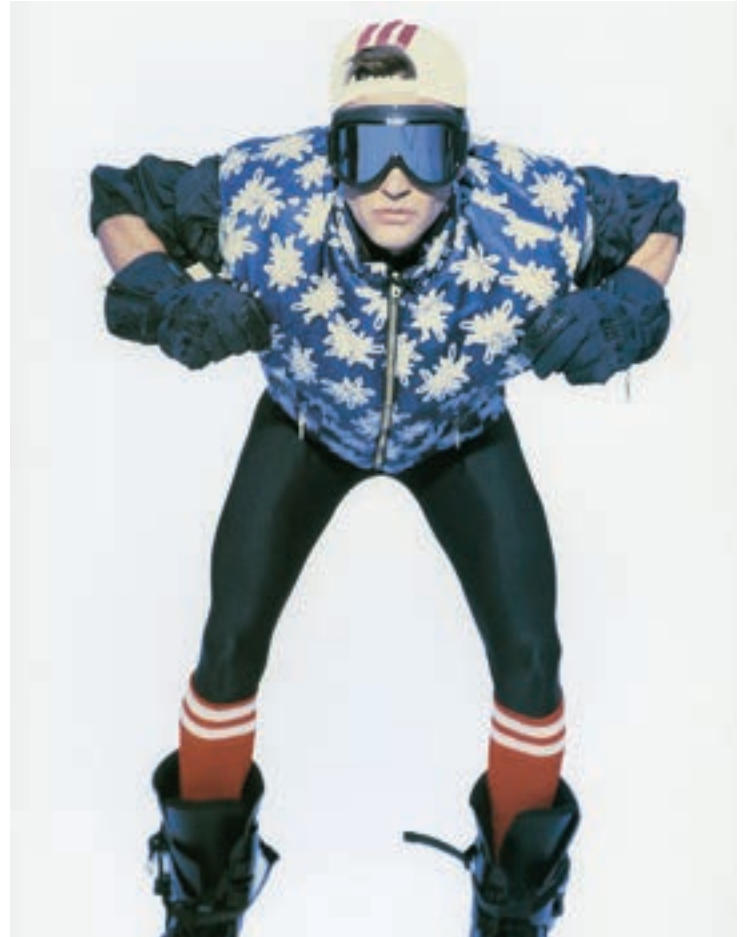
Strolz Snowsilk Kollektion mit Edelweißmotiv, 1994

Ob auf der Piste oder beim Après-Ski, wer in den Alpen modisch up to date sein will, blickt nach Lech. Mit Beginn des Wintertourismus entstanden vor Ort zahlreiche Schneidereien und Sporthäuser . Seit 100 Jahren steht die einstige Schuhmacherwerkstatt Strolz für Mode. Zahlreiche Leihgaben und Fotos schaffen eine Chronologie von der geschneiderten Keilhose bis zur High Functional Wear . Themen wie Materialität und Nachhaltigkeit oder die Wirkung von Farben spielen in der Ausstellung des Lechmuseums ebenso eine Rolle wie die Frage: „ Was hast Du für ein Lieblingsstück? “. In der offenen Nähwerkstatt können die Besucher*innen selbst Mode gestalten . Text: Monika Kühne