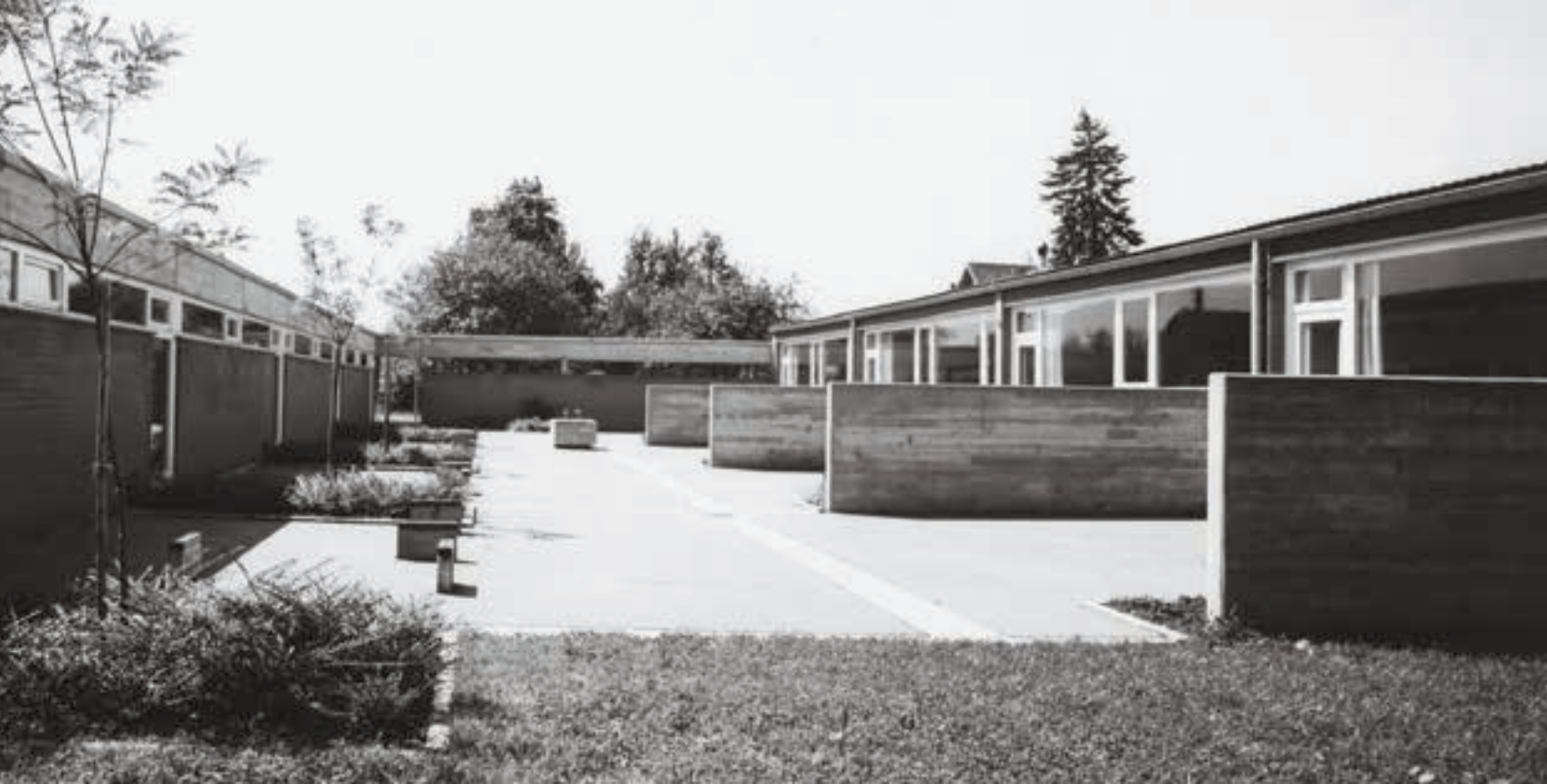
Volksschule Lustenau-Hasenfeld (1961–64), Foto: Walpurga Wengler