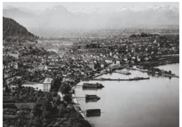
unten: Den Passagieren des Zuges aus Lindau bot sich 1902 seeseitig ein beeindruckender Anblick, nämlich die drei großen Bregenzer Badeanstalten: das Schanzbad, die Militärschwimmschule und dem Hafen zu die kolossale Städtische Badeanstalt.