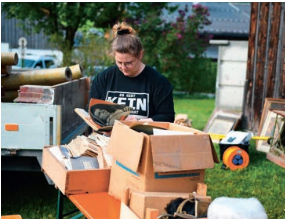
Das ehemalige Kuratenhaus in Au/Rehmen, erbaut im Jahre 1780, war einst Wohnhaus eines Priesters. Das denkmalgeschützte Haus, in dem nun das Barockbaumeister-Museum entsteht, stand über viele Jahre leer. Bei der großen Räumaktion 2020 halfen Mitglieder des Vereins akkurat und viele Freiwillige mit.

Das Hauptaugenmerk in Au gilt vorrangig der Frage, wie die Handwerker und Bauunternehmer, die Lehrlinge und die Lohnarbeiter auf den Baustellen – und daheim die Frauen – ihre