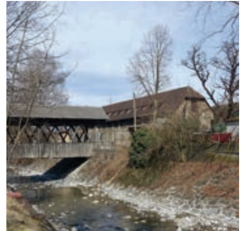
Holzbrücke über die Samina und Wollaschopf