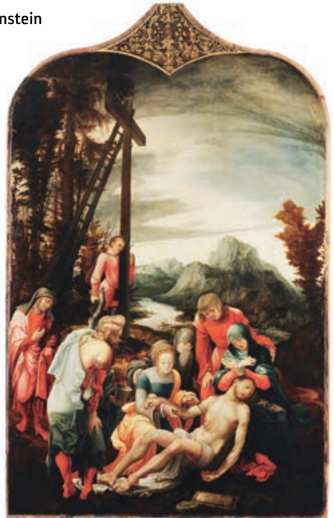
Wolf Huber, Beweinung Christi , 1521, St. Annenaltar, Feldkirch, Dom St. Nikolaus