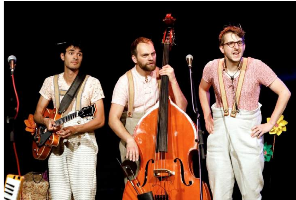
Theater Marabu

Weitere Informationen auf www.vorarlbergmuseum.at/veranstaltungen