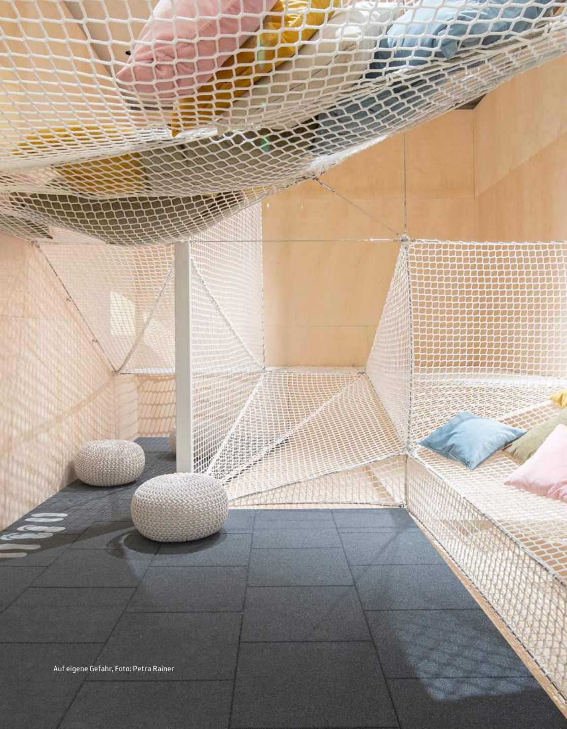
Auf eigene Gefahr, Foto: Petra Rainer