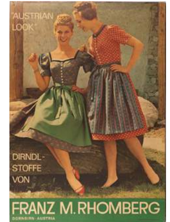
Dirndl Plakat 1963, Stwoliński Zürich-Wirtschaftsarchiv Vorarlberg

Kosten: 10 Euro (inkl. Eintritt und Führung)