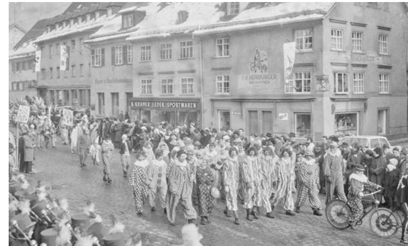
Faschingsumzug Bregenz, 1963

Di, 8. Februar, 15.00 Uhr Fasnat – Fasching. Erlebnisse in der fünften Jahreszeit