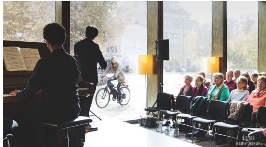
Konzert am Mittag, Foto: Victor Marin

Do, 24. Februar, 12.15 Uhr Fräulein Klarinette: Meisterwerke aus der Romantik Klarinettenklasse Francesco Negrini