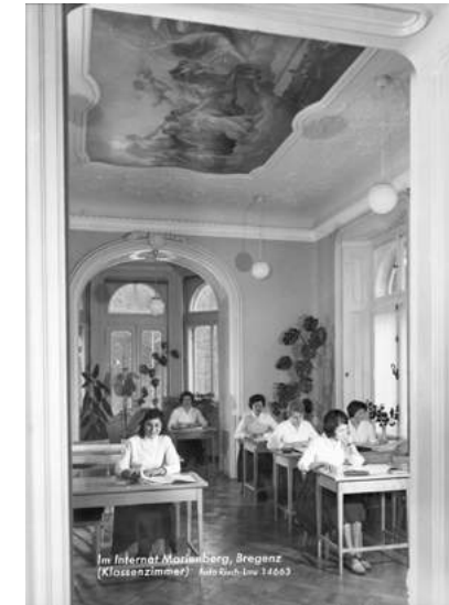
Internat Marienberg, 1961, Foto: Sammlung Risch-Lau, Vorarlberger Landesbibliothek

Welche Erinnerungen verbinden Sie mit ehemaligen Schüler*innen und Lehrer*innen? Wie war der Schulweg? Welcher war Ihr bester Streich und wie hat Sie die Schulzeit geprägt?