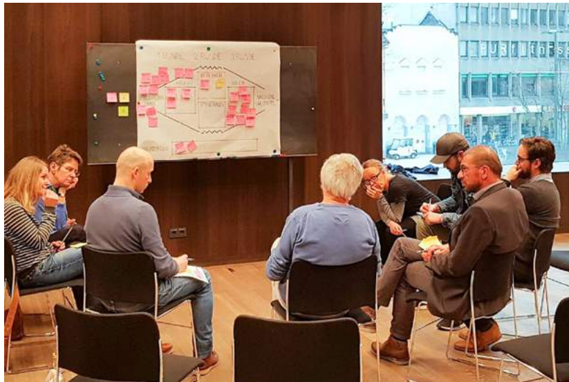
Projektschmiede, Foto: Büro für Zukunftsfragen

Anmeldung unter +43 (0)5574 511 20605 oder aoh-vorarlberg.at/projektschmiede .