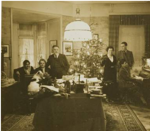
Weihnachten 1935

Di, 14. Dezember, 15.00 Uhr Weihnachtsgeschichten