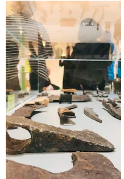
Führung Weltstadt oder so

Auf eigene Gefahr. Vom riskanten Wunsch nach Sicherheit